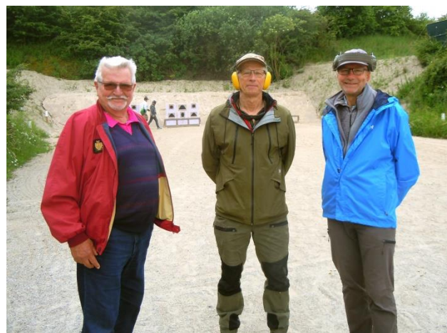
VIP holdet på feltsportens skydebane: X 2 formanden X-formanden Høje Formand, som deltog hos feltsporterne Desværre ingen svenskere