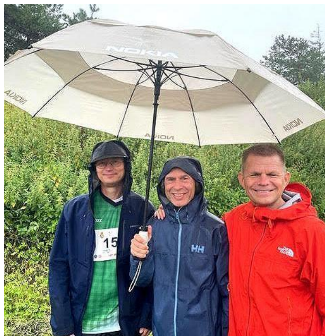
Der var brug for paraplyerne