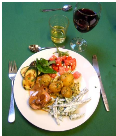
Hovedretten - grill kalvefilet Derefter rabarber-makron dessert.