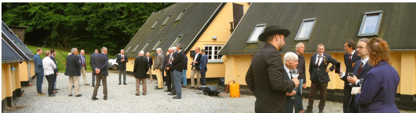
Formanden byder igen velkommen i lejrgaden før middagen. Det var dog ikke alle, som opdagede det lige med det samme.