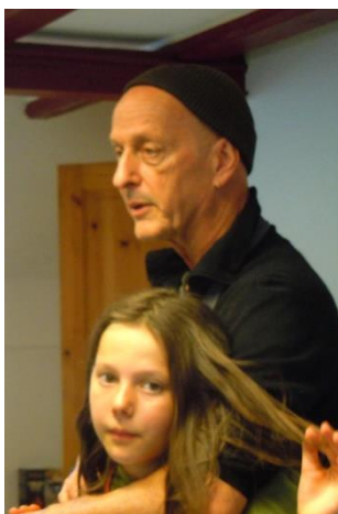
Kokken med datter forklarer menuen.