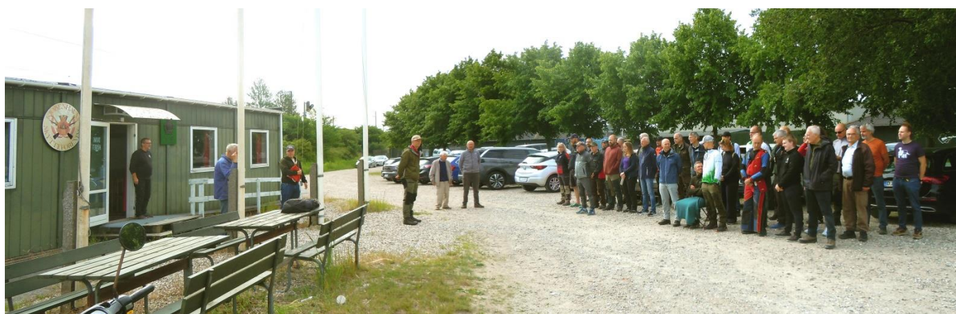
Høje Formand byder velkommen ved flaghejsningen foran SKAK-huset på Kalvebod